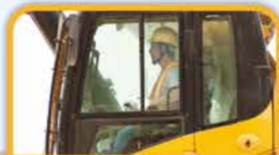
隔離塵埃 附設高效率靜電除塵器