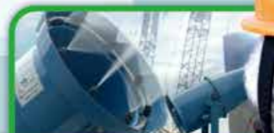
自動啟動減塵裝置 霧化減塵