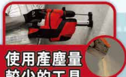
使用產塵量較少的工具 附設吸塵系統的工具