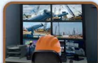
智能減塵 智能實時監測系統